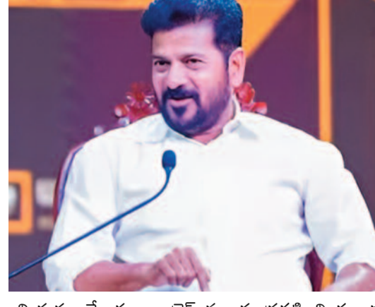
అని స్పష్టం చేశారు. కాంగ్రెస్ ముందు ప్రకటించి తర్వాత

శుక్రవారం హైదరాబాద్ వేదికగా సీఎం మాట్లాడారు. టీడీపీలో పదేళ్లు పనిచేశానని.. సీఎం చంద్రబాబు ఇప్పటికీ తనను గౌరవిస్తారని ప్రస్తావించారు. పార్టీని వదిలిపెట్టిన తర్వాత నాయకుల మధ్య మంచి సంబంధాలు ఉండటం చాలా అరుదని తెలిపారు.. పార్టీని వదిలిపెట్టే సమయంలో విజయవాడకు వెళ్లి చంద్రబాబుకు చెప్పి వచ్చానని గుర్తుచేశారు.. కాంగ్రెస్ను దేశంలో అధికారంలోకి తేవాలని రాహుల్ గాంధీకి లక్ష్యం ఉందని...కాని ప్రధాని కావాలన్న లక్ష్యం లేదని స్పష్టం చేశారు. వికారాబాద్ లో జరిగిన కాంగ్రెస్ సమావేశంలో ప్రధాని పదవి తీసుకోవాలని తానే రాహుల్ గాంధీకి చెప్పి ఒప్పించానని ప్రస్తావించారు. ఇప్పుడు జనం సిగ్గు పాలిట్ క్స్ కోరుకుంటున్నారని అన్నారు. వచ్చే ఎన్నికల్లో ఇండియా కూటమి నుంచి ప్రధాని అభ్యర్థి రాహుల్ గాంధీనే