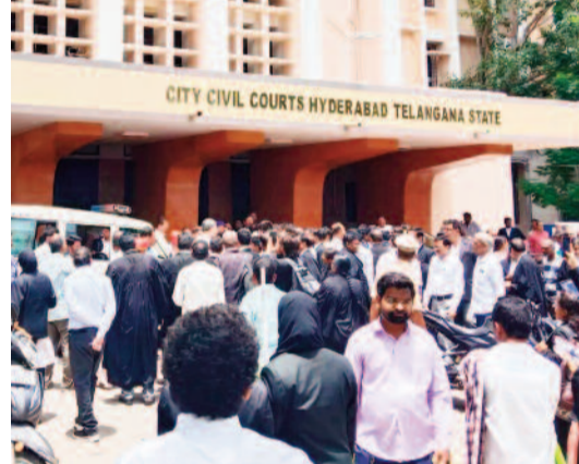
ఇప్పటివరకు సోషల్ మీడియాలో పోస్ట్ చేసిన వీడియో క్లిప్పింగులు, డిజిటల్ కంటెంట్, పత్రికా కటింగులు, వాల్ పోస్టర్లను తక్షణం తొలగించాలని స్పష్టం చేసింది. ఈ నెల