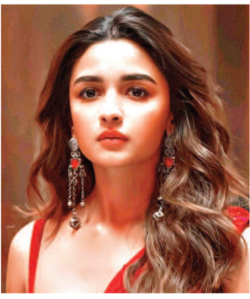
బాలీవుడ్ ప్రముఖ నటి అలియా భట్ అంతర్జాతీయ సినీ ఉత్సవ వేదికపై చేసిన వ్యాఖ్యలు ఇప్పుడు సినీ వర్గాల్లో పెద్ద చర్చకు దారితీశాయి. భారతీయ చిత్ర పరిశ్రమలో ఇప్పటికే

పురుషాధిక్యత కొనసాగుతోందని ఆమె చేసిన వ్యాఖ్యలు సామాజిక మాధ్యమాలలో వైరల్ గా మారాయి. సినిమాల్లో కథ కంటే హీరోలకు ఎక్కువ ప్రాధాన్యత ఇస్తున్నారని అలియా అభిప్రాయపడ్డారు. చాలా చిత్రాలు ఇప్పటికీ హీరోల చుట్టూనే తిరుగుతున్నాయని, కథ బలంగా ఉండటమే అసలు ముఖ్యమని ఆమె పేర్కొన్నారు. సినిమాను విజయవంతం చేసేది కేవలం హీరో కాదని, మంచి కథే ప్రేక్షకులను ఆకట్టుకుంటుందని చెప్పారు. ఆమె వ్యాఖ్యలకు సామాజిక మాధ్యమాలలో భిన్న స్పందనలు వస్తున్నాయి. కొందరు అలియా ధైర్యంగా నిజం మాట్లాడిందని ప్రశంసిస్తుండగా, మరికొందరు మాత్రం తీవ్ర విమర్శలు చేస్తున్నారు. భారతీయ సినిమాను తక్కువ చేసి మాట్లాడుతున్నారని కొందరు అభిప్రాయపడుతున్నారు. ఇక ఆమె భర్త నటించిన కొన్ని చిత్రాల్లో కూడా పురుషాధిక్యత కనిపించిందని, అలాంటి సినిమాలపై ఎందుకు స్పందించలేదని నెటిజన్లు ప్రశ్నిస్తున్నారు. పరిశ్రమలో మార్పు గురించి మాట్లాడేవారు ముందుగా తమ చుట్టూ ఉన్న విషయాలపై స్పందించాలని కొందరు వ్యాఖ్యానిస్తున్నారు. మరోవైపు అలియా చెప్పిన విషయాల్లో నిజం ఉందని పలువురు సినీ అభిమానులు అభిప్రాయపడుతున్నారు. హీరోలకు భారీ పారితోషికాలు, ప్రత్యేక ప్రాధాన్యత, విస్తృత ప్రచారం లభిస్తున్నప్పటికీ హీరోయిన్లకు సమాన గుర్తింపు దక్కడం లేదని చర్చ జరుగుతోంది. గతంలో కూడా పలువురు నటీమణులు సినీ పరిశ్రమలో మహిళలకు సరైన ప్రాధాన్యత దక్కడం లేదని బహిరంగంగానే వ్యాఖ్యానించారు. ఇప్పుడు అలియా వ్యాఖ్యలతో మరోసారి భారతీయ సినిమాల్లో కథలకు ప్రాధాన్యత పెరగాల్సిన అవసరంపై చర్చ మొదలైంది.