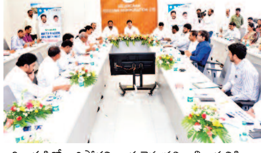
ఇది ఇక్కడితో ఆగిపోదని, అర్బులైన ప్రతి లబ్ధిదారునికి ఇల్లు అందే వరకు మాజీ, నాలుగో విడతలుగా కొనసాగుతుందని స్పష్టం చేశారు. ఉమ్మడి రాష్ట్రంలో ఇందిరమ్మ పథకం కింద రూ.20 వేల వరకు సాయం పొందిన వారికి కూడా మళ్లీ ఇందిరమ్మ ఇండ్లు మంజూరు చేస్తామని తెలిపారు. పైలట్ గ్రామాల్లో 600 చదరపు అడుగులకు పైగా నిర్మించిన

గూడులేని ప్రతి అర్థ పేద కుటుంబానికి సొంత ఇల్లు కల్పించడమే ప్రభుత్వ లక్ష్యమని పేర్కొన్నారు. దేశంలో ఏ రాష్ట్ర ప్రభుత్వం ఇప్పటి వరకూ ఒక్కో ఇంటికి రూ.5 లక్షల ఆర్థిక సాయం అందిస్తూ తెలంగాణ ప్రభుత్వం పేదల గృహనిర్మాణంలో దేశానికి ఆదర్శంగా నిలుస్తోందన్నారు. తొలి విడతలో 3 లక్షలకు పైగా ఇండ్లను మంజూరు చేశామని, అందులో 2.90 లక్షల ఇండ్లకు గ్రౌండింగ్ పూర్తి కాగా ఇప్పటికే సుమారు 50 వేల గృహప్రవేశాలు జరిగాయని తెలిపారు. మరో రెండు లక్షలకు పైగా ఇండ్లు వివిధ దశల్లో నిర్మాణంలో ఉన్నాయని, రెండు నెలల్లో పూర్తి అవుతాయని చెప్పారు. ప్రతి నియోజకవర్గానికి 3,500 ఇండ్ల మంజూరు చేసినట్లు మంత్రి వెల్లడించారు. ఐటీడీఏ ప్రాంతాల నియోజకవర్గాలకు అదనపు ఇండ్లు కేటాయించినట్లు తెలిపారు. రెండో విడత ఇందిరమ్మ ఇండ్ల మంజూరు కార్యక్రమాన్ని జూన్ 2న ఆదిలాబాద్ జిల్లాలో ప్రారంభిస్తామని పేర్కొన్నారు.