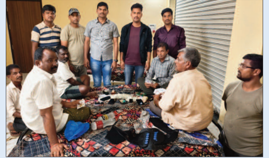
వేల్పుల నగర్, జనం పవర్-ఉమ్మడి అదిలాబాద్ జిల్లా బ్యూరో

బాలాజీ లాడ్జీలో జూదం ఆడుతున్న ఆరుగురు అరెస్ట్ రూ. 1.20 లక్షల నగదు, సెల్ ఫోన్లు స్వాధీనం నిందితులతో పాటు లాడ్జి యజమానిపై కేసు నమోదు