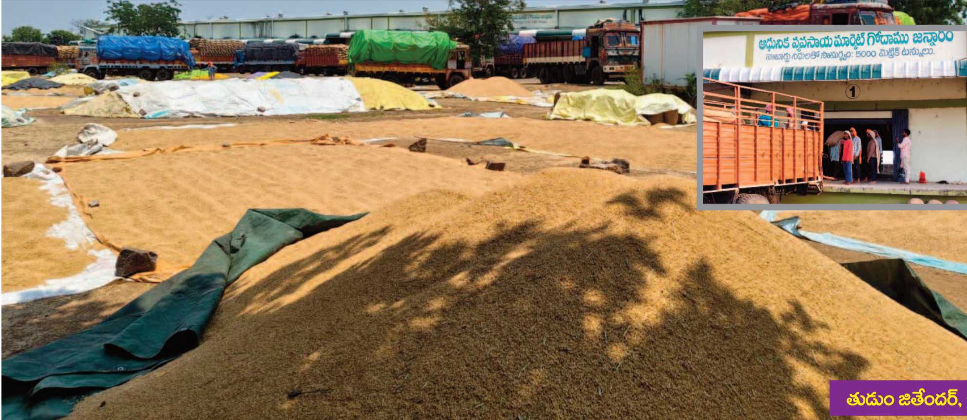
తుడుం జతేందర్, జనం పవర్, ఉత్తర తెలంగాణ బ్యూరో

జన్మారం మండలంలో ధాన్యం కొనుగోలు కేంద్రాల అన్నదాతల పాలిట యమపాశాలుగా మారాయి. ఒకవైపు అకాల వర్షాల భయం వెంటాడుతుంటే.. మరోవైపు ఐకేపీ, పీఏసీఎస్ కేంద్రాల నిర్వాహకులు తూకంలో మోసాలు, అక్రమ వసూళ్లతో రైతుల నడ్డి విరుస్తున్నారు. ప్రభుత్వ నిబంధనలను బేఖాతరు చేస్తూ బస్తాకు మూడు కిలోల వరకు అదనంగా తూకం వేస్తూ.. లారీ లోడింగ్ పేరుతో వేల రూపాయలు దండుకుంటూ బహిరంగంగానే దోపిడీకి తెరలేపారు.