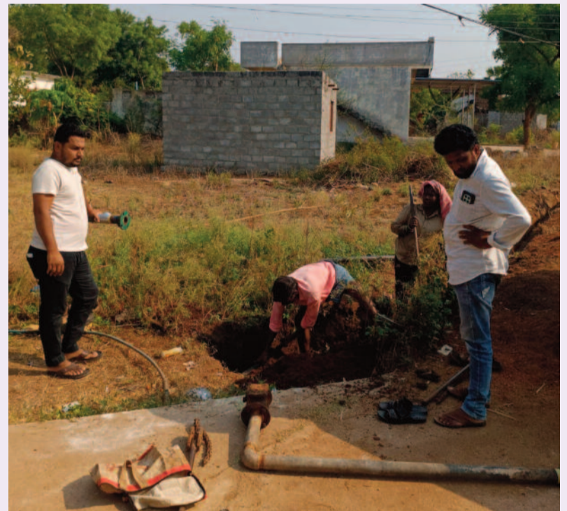
జనం పవర్ - సిద్దిపేట ప్రతినిధి నంగునూర్ మండలం మైసంపల్లి గ్రామంలో తాగునీటి సమస్యను అరికట్టేందుకు గ్రామ పంచాయతీ పకడ్బందీ చర్యలు చేపట్టింది. 15వ ఫైనాన్స్