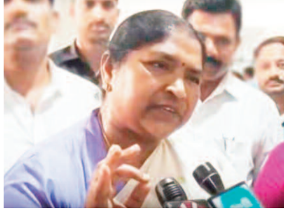
అన్నార. ఈ కేసులో సీట్ ఏర్పాటు చేయడం కాలయాపన కోసం కాదని, నిజానిజాలు వెలికితీయడానికేనని పేర్కొన్నారు.