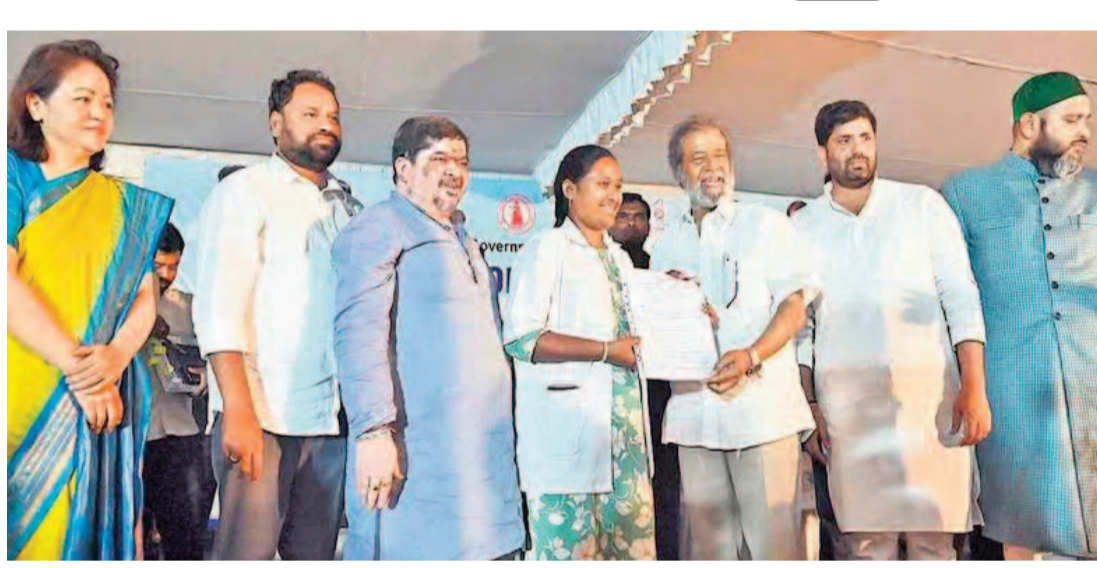
క్రమశిక్షణ, శాస్త్రీయ వైద్య సేవల ప్రాముఖ్యతను ప్రపంచానికి చాటిచెప్పిన మహానీయురాలు ఆమె.మీరు అందరూ ఆమెను ఆదర్శంగా తీసుకుని పనిచేయాలి. కోవిడ్ లో కుటుంబ సభ్యులు కూడా పేషెంట్ల దగ్గర ఉండలేని పరిస్థితి, అటువంటి భయంకరమైన పరిస్థితుల్లో కూడా నర్సులు సేవలు అందించారు. తెలంగాణ ప్రజలు ఆ సేవలను ఎప్పుడీ గుర్తుంచు కుంటారు. గతంలో ప్రభుత్వ హాస్పిటల్లలో భారీగా ఫ్యామిలీ ఉండటం వల్ల వైద్య సిబ్బందిపై తీవ్ర ఒత్తిడి ఉండేది. ఈ సమస్యను మా ప్రభుత్వం అత్యంత ప్రాధాన్యతతో తీసుకుని భారీ స్థాయిలో నియామకాలు చేపట్టింది. గత రెండున్నరేళ్లలో ఆరోగ్యశాఖలో దాదాపు 13 వేల పోస్టులను భర్తీ చేశాం. ఇదే గ్రాండ్ లో ఇప్పటికే 1,257 మంది ల్యాబ్ టెక్నిషియన్లకు నియామక పత్రాలు అందజేశాం. ఇక్కడే