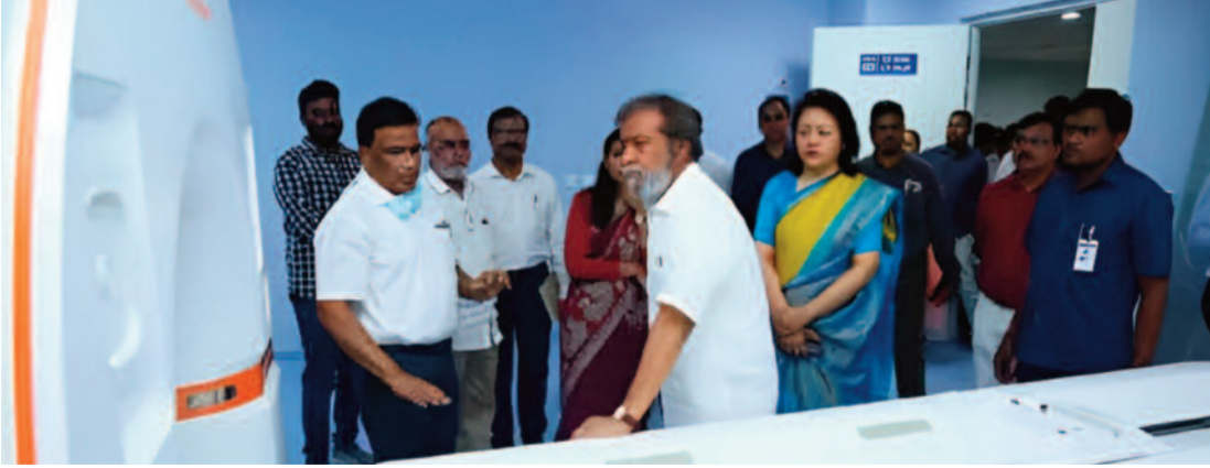
రూమ్స్, దయాగ్రూప్స్, ఇన్ పేషెంట్ వార్డులు, ఫార్మసీ తదితర ఏర్పాట్లను పరిశీలించిన మంత్రి.. రిజిస్ట్రేషన్ కౌంటర్స్, ఫార్మసీ కౌంటర్స్ పెంచాలని మంత్రి సూచించారు. సీట్ స్టాన్, ఎంఆర్ఐ, ఎక్స్ రే, ఆల్ట్రాసౌండ్ తదితర యంత్రాలను పరిశీలించిన మంత్రి.. ఆద్యాన్స్ డెవలప్ మెంట్ అందుబాటులోకి తీసుకువచ్చిన ఈ యంత్రాల పూర్తిస్థాయిలో పేషెంట్లకు ఉపయోగపడాలని, ఇందుకు అవసరమైన డాక్టర్లు, ఇతర సిబ్బందిని సిద్ధంగా ఉంచుకోవాలని ఆరోగ్యశాఖ అధికారులను మంత్రి ఆదేశించారు. జూనియర్ సనత్ నగర్ టీమ్ ను ప్రారంభిస్తామని అన్నారు. ఇక్కడ సెక్యూరిటీ వైద్య సేవల

హైదరాబాద్, మే 12: సనత్ నగర్ టీమ్ లో జరుగుతున్న వైద్య సేవల ట్రయల్ రన్ ను ఆరోగ్యశాఖ మంత్రి దామోదర్ రాజనర్సింహ పరిశీలించారు. హాస్పిటల్ భాగాలన్నీ మంత్రి కలియ తిరిగారు. ఓపీ రిజిస్ట్రేషన్, ఐపీ వార్డులు, ఎమర్జెన్సీ డిపార్ట్ మెంట్, సీట్ స్టాన్, ఎంఆర్ఐ, ల్యాబులు, మెకనైజ్డ్ ల్యాండ్రింగ్, కిచెన్ తదితర అన్ని డిపార్ట్ మెంట్లను మంత్రి పరిశీలించారు. పెండింగ్ వసులన్నీ యుద్ధ ప్రాతిపదికన పూర్తి చేయాలని ఆర్ అండ్ బీ, ఆరోగ్యశాఖ అధికారులకు మంత్రి సూచించారు. హాస్పిటల్ కు సీట్ల, పవర్ సప్లై ఎలాంటి అటంకం ఉండకూడదని, 24 గంటల సరఫరా ఉండాలని మంత్రి సూచించారు. ఫైర్ సేఫ్టీ విషయంలో రాజీ ఉండకూడదని, అన్ని ఫైర్లో మరోసారి పూర్తిస్థాయి పరిశీలన చేయాలని అధికారులను ఆదేశించారు. రిసెప్షన్ ఏరియా, హెల్త్ డెస్క్, ఓపీ కౌంటర్లు, వెయిటింగ్ హాల్, ఓపీ కన్సల్టేషన్