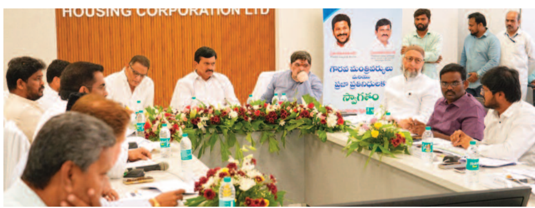
తీసుకుని స్థల సేకరణ చేయాలి" అని అధికారులకు సూచించారు. కాలనీల్లో డ్రైనేజీ, మంచినీరు వంటి కనీస వసతుల కల్పనకు ప్రాధాన్యత ఇవ్వాలని ఆదేశించారు.

ఈ సందర్భంగా మంత్రి మాట్లాడుతూ.. రెండో విడత అమలుకు సంబంధించిన పూర్తి విధివిధానాలను ఈ నెల 21న జరిగే మంత్రివర్గ సమావేశంలో చర్చించి ఖరారు చేస్తామని తెలిపారు. గత ప్రభుత్వ హయాంలో నిర్మించిన డబల్ టెక్ రూమ్ ఇళ్ల పంపిణీలో జరుగుతున్న జాప్యంపై మంత్రి అసహనం వ్యక్తం చేశారు. పూర్తయిన ఇళ్లకు లబ్ధిదారులకు అప్పగించేందుకు తక్షణమే 'స్పెషల్ డ్రైవ్' నిర్వహించాలని అధికారులను ఆదేశించారు. ఈ నెలాఖరులోపు లబ్ధిదారుల గుర్తింపు ప్రక్రియ పూర్తి కావాలని స్పష్టం చేశారు. ముఖ్యంగా హైదరాబాద్ పరిధిలో సొంత స్థలాలు ఉండి, ఇల్లు లేని అర్హులకు ఈ నెల చివరలోనే పంజారు పత్రాలు అందజేయాలని అధికారులకు డెడ్లైన్ విధించారు. గత ప్రభుత్వం నగరం నుంచి 30 కిలోమీటర్ల దూరంలో ఇళ్ల కట్టడం వల్ల పేదలు నివసించడానికి వెనుకాడుతున్నారని అంగులేటి విమర్శించారు. "ప్రస్తుత ప్రభుత్వం ఆ తప్పు చేయదు. పేదవాడు నివసించే ప్రాంతానికి 5 నుండి 8 కిలోమీటర్ల పరిధిలోనే ఇళ్లు నిర్మించాలని నిర్ణయించాం. నియోజకవర్గాన్ని యూనిట్ గా