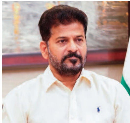
ధాన్యం లోడింగ్లో జాప్యం జరగకుండా స్థానికంగా ఉన్న హమామీలను గుర్తించి వారితో పని చేయమనే కోరికను సీఎం రేవంట్ తెలిపారు. ధాన్యం లోడ్ చేసిన వెంటనే రైతులకు రశీదు అందేలా చర్యలు తీసుకోవాలన్నారు. దగ్గరగా ఉన్న

కొనుగోలు కేంద్రాల్లో రైతులకు ఎలాంటి ఇబ్బందులు కలగకుండా చూడాలని సీఎం ఆదేశించారు. అధికారులు క్షేత్రస్థాయికి వెళ్లి కొనుగోళ్ల తీరును పరిశీలించాలని.. గన్ను బ్యాగులు, హమాబీల కొరత లేకుండా చూసుకోవాలని సూచించారు. కొనుగోలు చేసిన ధాన్యాన్ని ఎప్పుడీ కప్పుడు గోడౌన్స్ కు తరలించాలని ఆదేశించారు. ధాన్యం తరలింపును అవసరమైన వాహనాలను అందుబాటులో ఉండేలా చూడాలని రవాణా శాఖ కమిషనరుకు ఆదేశాలు జారీ చేశారు. సమస్య తీవ్రతను గుర్తించి జిల్లా కలెక్టర్లకు సరైన చర్యలు తీసుకోవాలి అని.. ప్రతి అధికారి జవాబుదారీ తనంతో వ్యవహరించాలి అని తెల్పింది. నిర్లక్ష్యం వహిస్తే కలెక్టర్లపై చర్యలకు ప్రభుత్వం వెనకాడదని హెచ్చరించారు. గోడౌన్స్ సమస్య ఉన్న ప్రాంతాల్లో అవసరాన్నిబట్టి తాత్కాలిక ఏర్పాట్లు చేసుకోవాలని ముఖ్యమంత్రి సూచించారు. రైతుబజారు, ఫంక్షన్ హాల్స్ ను ఎంగేజ్ చేసి ధాన్యాన్ని తరలించాలన్నారు. వెసులుబాటు ఆధారంగా అక్కడినుంచి గోడౌన్స్ కు తరలించేలా ప్రణాళికలుండాలని తెలిపారు. కొనుగోళ్లపై ఎప్పుడీ కప్పుడు సీఎస్ కు పోర్ట్ పంపించాలని సీఎం రేవంట్ రెడ్డి ఆదేశించారు.