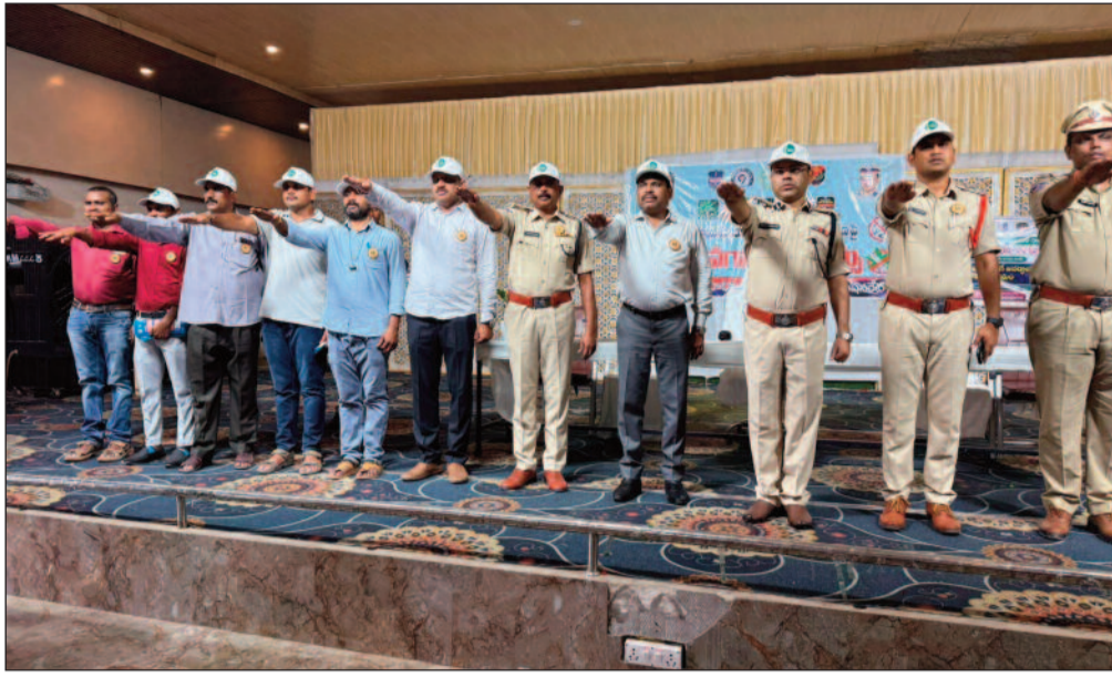
వెంటనే సహాయం పొందాలని సూచించారు.