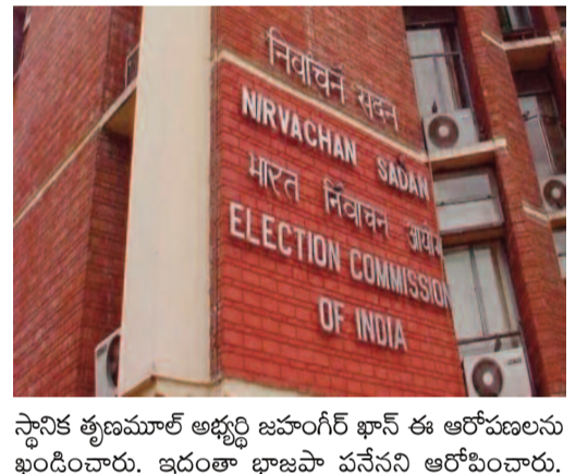
స్థానిక తృణమూల్ అభ్యుదయ పార్టీ జనాగీర్ ఖాన్ ఈ ఆరోపణలను ఖండించారు. ఇదంతా భాజపా పనేనని ఆరోపించారు.

గుర్తింపు కార్డు కలిగి ఉన్నవారిని మాత్రమే కొంటింగ్ కేంద్రాల్లోకి అనుమతించనున్నట్లు పేర్కొంది. దక్షిణ 24 పరగణాల జిల్లాలో రెండు అసెంబ్లీ నియోజకవర్గాల్లోని 15 పోలింగ్ కేంద్రాల్లో రిపోలింగ్ కొనసాగుతోంది. సాయంత్రం 5 గంటల సమయానికి 86 శాతానికి పైగా పోలింగ్ సమాప్తమైంది. మరోవైపు ఓట్ల లెక్కింపు తర్వాత తమకు భద్రత కల్పించాలని డిమాండ్ చేస్తూ ఇదే జిల్లాలోని ఫలాలో వందలాది మంది నిరసన చేపట్టారు. ఈ ప్రాంతంలోని టీఎంసీ కార్యకర్తల నుంచి తమకు ప్రాణ హాని ఉందన్నారు. ఎన్నికల ఫలితాలు వెలువడిన తర్వాత తమపై దాడులు చేస్తామని వారు బెదిరించారని ఆరోపించారు. సీఆర్ఎఫ్ డిప్యూటీ కమాండెంట్ ఆ ప్రాంతాన్ని సందర్శించి.. భద్రతకు భరోసా ఇచ్చారు.