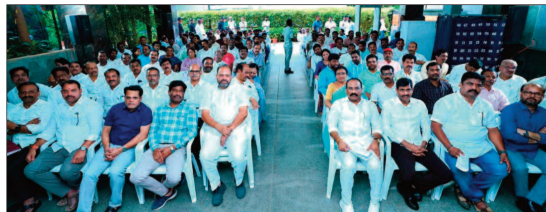
కార్కుల ప్రతిపాదనపై సానుకూలంగా స్పందించినారని. ఈ రెండేళ్ల ప్రజా ప్రభుత్వంలో 67,760 ఉద్యోగ నియామకాలు చేపట్టినట్లు ఆయన చెప్పుకొచ్చారు. 'ఇది డ్రాండ్ ప్రభుత్వం.. మీ సమస్యలను పరిష్కరించే బాధ్యత మాది' అంటూ సీఎం రేవంత్ రెడ్డి భరోసా కల్పించారు.

ప్రతీ రెండు నెలలకోసారి గుర్తింపు సంఘాలు సమావేశమై సమస్యలపై ప్రభుత్వానికి రిపోర్టు అందించాలని పేర్కొన్నారు. ప్రభుత్వం ఏ పథకాన్ని ప్రకటించినా ఉద్యోగులు భుజాన వేసుకుని పని చేశారని ప్రశంసించారు. వారి సహకారంతోనే ప్రభుత్వ సంక్షేమ పథకాలను విజయవంతంగా అమలు చేయగలుగుతున్నామని కొనియాడారు. కాంగ్రెస్ ప్రభుత్వం అధికారంలోకి వచ్చిన వెంటనే ఉద్యోగుల కోసమే మొదటి నిర్ణయం తీసుకున్నామని గుర్తు చేశారు. ఉద్యోగులకు ప్రతీ నెలా మొదటి తారీకునే జీతాలు అందేలా చర్యలు చేపట్టినట్లు రేవంత్ రెడ్డి చెప్పుకొచ్చారు. ఉద్యోగ సంఘాలు స్వేచ్ఛగా ఎన్నికలు నిర్వహించుకునేలా అవకాశం కల్పించామన్నారు. ఉద్యోగుల బదిలీ విషయంలో గందరగోళం తలెత్తకుండా ప్రణాళిక ప్రకారం చేసినట్లు చెప్పుకొచ్చారు. ఎంతో కాలంగా పెండింగ్ లో ఉన్న టీవర్ బదిలీలను ఎలాంటి వివాదం లేకుండా పూర్తి చేశామన్నారు. ఉద్యోగుల ఆరోగ్య భద్రతా