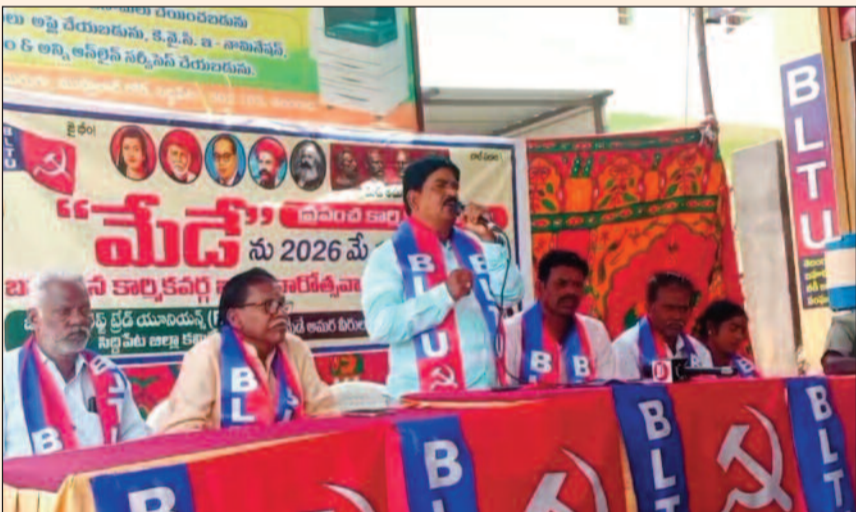
జనం పవర్ - సిద్దిపేట ప్రతినది

బీఎల్ యూ టీ రాష్ట్ర అధ్యక్షులు సిరిగాధ సిద్దిరాములు