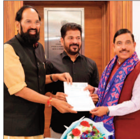
రైతుల నుంచి కొనుగోలు చేయబోతున్నాం. పరి ధాన్యం

న్యూఢిల్లీ, ఏప్రిల్ 17: 2025-26 వానాకాలం, యాసంగి సీజన్లకు సంబంధించి 30 లక్షల మెట్రిక్ టన్నుల పార్ బాయిల్డ్ ధాన్యం సేకరించాలని కేంద్రమంత్రికి సీఎం రేవంత్, మంతరి ఉత్తమ్ విజ్ఞప్తి చేశారు. అలాగే యాసంగి పంట 90 లక్షల మెట్రిక్ టన్నులు వస్తుందని కేంద్రమంత్రి ప్రవృద్ధి జోషికి సీఎం రేవంత్ వివరించారు. ఈ ధాన్యం మె-త్తం కొనుగోలు చేసి తెలంగాణ రైతాంగానికి అందగా నిలవాలని కోరారు. కేంద్ర పౌరసరఫరాల శాఖ మంత్రి ప్రవృద్ధి జోషితో తెలంగాణ సీఎం రేవంత్ రెడ్డి, మంత్రి ఉత్తమ్ కుమార్ రెడ్డి భేటీ అయ్యారు. కేంద్ర పౌరసరఫరాల శాఖ నుంచి రాష్ట్రానికి రావాల్సిన పెండింగ్ నిధులు, ఇతర అంశాలపై చర్చించారు. కేంద్ర మంత్రితో భేటీ అనంతరం మంత్రి ఉత్తమ్ కుమార్ రెడ్డి మాట్లాడుతూ.. 'దేశంలోనే అత్యధికంగా తెలంగాణలో పరిధాన్యం ఉత్పత్తి జరుగుతోంది. ఈ రబీ సీజన్లో 90 లక్షల మెట్రిక్ టన్నుల పరి ధాన్యం