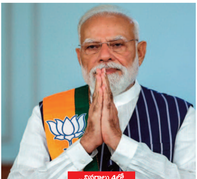
.. వివరాలు 4లో

చట్టసభల్లో వారి ఉనికి చాటేందుకు అవకాశం దేశ మహిళలకు లేఖలో ప్రధాని మోడీ వెల్లడి