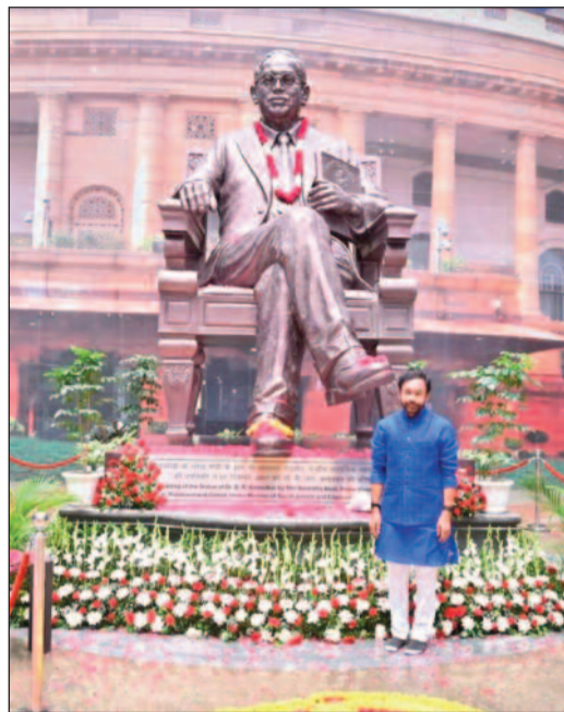
వెంకయ్య నాయుడు ఉపరాష్ట్రపతిగా పని చేశారని, శాసన ఒక్కటినే మేధావిని అనుకుని అధ్యక్షుడు మేడలో కూర్చుని

న్యూఢిల్లీ, ఏప్రిల్ 14: తెలంగాణ సీఎం రేవంత్ రెడ్డి వ్యాఖ్యలను కేంద్రమంత్రి కిషన్ రెడ్డి ఖండించారు. సీఎం రేవంత్ రెడ్డి బంట్లోతు పోస్ట్ డొరకడని అంటున్నారు. ప్రజలను బంట్లోతుగా చూస్తున్నారని ఆగ్రహించారు. ఉత్తరాది, దక్షిణాది రాష్ట్రాల మధ్య విభజన తీసుకొచ్చే విధంగా రేవంత్ రెడ్డి మాట్లాడుతున్నారని ధ్వజమెత్తారు. రేవంత్ రెడ్డి తప్పుడు మాటలు మాట్లాడడం, వాస్తవాలు మాట్లాడాలని సూచించారు. రేవంత్ రెడ్డి వ్యాఖ్యలు బాబా సాహెబ్ అంబేద్కర్ ఆశయాలకు వ్యతిరేకంగా ఉన్నాయని అన్నారు. రేవంత్ రెడ్డి వితండవాదలు పక్కన పెట్టాలని కిషన్ రెడ్డి హితవు పలికారు. మంగళవారం ఢిల్లీలో మీడియాతో కిషన్ రెడ్డి మాట్లాడారు. కాంగ్రెస్ వ్యతిరేకంగా ఉన్న పార్టీ డిమాండ్ అని తెలిపారు. తెలుగువారి ఆత్మగౌరవంగా డిమాండ్ పుట్టినది ప్రస్తావించారు. దక్షిణాది రాష్ట్రాలనుంచి ఇద్దరు ఉపరాష్ట్రపతులుగా ఉన్నారని ప్రస్తావించారు.