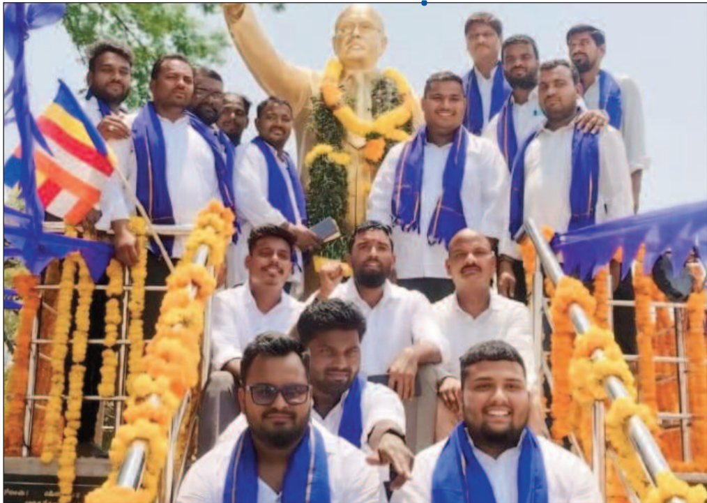
సాధ్యమని అన్నారు. ఈ కార్యక్రమంలో స్థానిక పెద్ద సంఖ్యలో పాల్గొన్నారు. కార్యక్రమం ప్రజాప్రతినిధులు, నాయకులు, కార్యకర్తలు, యువత శాంతియుతంగా, ఘనంగా నిర్వహించబడింది.