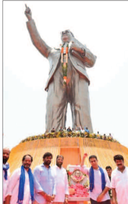
ప్రయత్నాలు జరుగుతున్నాయిని.. మహాత్మా గాంధీ లాగే అంబేద్కర్ అందరి వాడని స్పష్టం చేశారు. 'జై భీమ్, జై కేసీఆర్, జై తెలంగాణ' నినాదాలతో ముందుకు సాగుతామని కేటీఆర్ స్పష్టం చేశారు.

రాష్ట్రాన్ని సాధించారని కేటీఆర్ పేర్కొన్నారు. గురుకులాలను రేవంత్ రెడ్డి ప్రభుత్వం వట్టింపుకోవడం లేదని విమర్శించారు. గురుకులాల్లో మరణ మృదంగం మోగుతోందని ఆవేదన వ్యక్తం చేశారు. కాంగ్రెస్ పార్టీ అంబేద్కర్ను రాజకీయ అవసరాలకు మాత్రమే వాడుకుంటోంది తప్ప.. ఎన్నడూ నిజమైన గౌరవం ఇవ్వలేదని విమర్శించారు. కాంగ్రెస్ ప్రభుత్వం ఉన్నంత కాలం అంబేద్కర్కు భారతరత్న ఇవ్వలేదన్నారు. అంబేద్కర్ అభయ హస్తం పథకాన్ని అమలు చేయకుండా ఆయనను అగౌరవపరుస్తున్నారని ఆరోపించారు. దళిత బంధు లాంటి పథకాలను తీసుకొచ్చిన కలేజా ఉన్న నాయకుడు కేసీఆర్ అని కేటీఆర్ కొనియాడారు. ఎస్సీ, ఎస్టీ, బీసీలకు ప్రభుత్వ కాంట్రాక్టుల్లో అవకాశాలు ఇస్తామని కాంగ్రెస్ మోసం చేసిందని మాజీ మంత్రి విమర్శించారు. లక్షన్నర కోట్ల కాంట్రాక్టుల్లో 72 శాతం ఎస్సీ, ఎస్టీ, బీసీలకు ఇచ్చారా అని ప్రశ్నించారు. మూసి కాంట్రాక్టు ఎస్సీ, ఎస్టీ, బీసీలకు ఇస్తారా అని నిలదీశారు. కాంగ్రెస్ మోసాలను రాష్ట్రంలోని ప్రతి దళిత, బీసీ, మైనార్టీ కుటుంబాలకు చేర్చి పోరాడాలని కేటీఆర్ పిలుపునిచ్చారు. ఏప్రిల్ 20న జగిత్యాలలో జరిగే బహిరంగ సభకు కేసీఆర్ హాజరవుతానని ప్రకటించారు. కాంగ్రెస్ డిక్లరేషన్పై బహిరంగ సభలు నిర్వహించేలా ఎ+-లాన్ చేసుకోవాలని సూచించారు. పార్లమెంట్ భవనానికి అంబేద్కర్ పేరు పెట్టాలని బీజేపీని డిమాండ్ చేశామని.. అసెంబ్లీలో తీర్మానం కూడా చేశామని కేటీఆర్ తెలిపారు. బీజేపీ, కాంగ్రెస్ వాళ్లు ఏ మాత్రం గౌరవం ఉన్నా స్పందించే వారన్నారు. కాంగ్రెస్, బీజేపీ దౌండా దౌందే అని.. అంబేద్కర్ అంటే గిట్టని వారే అని విమర్శించారు. అంబేద్కర్ను కొందరి వాడుగా చిత్రీకరించే