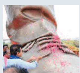
.. వివరాలు 3లో