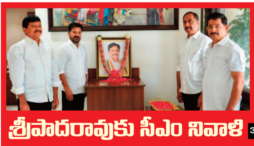
శ్రీపాదరావుకు సీఎం నివాళి

హైదరాబాద్, ఏప్రిల్ 13: సీట్ల పునర్విభజనలో పర్సంటేజీలు కాదు నెంబర్ ముఖ్యం అని సీఎం రేవంత్ రెడ్డి అన్నారు. రాజకీయాల్లో నెంబర్ ముఖ్యం అంటూ.. వాజపేయి ప్రభుత్వం ఒక్క ఓటుతో పడిపోయిందని గుర్తు చేశారు. నెంబర్ లేకుండా రాజకీయాల్లో ఎవరూ ఎవరితోనూ చర్చలు చేయరని అన్నారు. ఇకపోతే ఇప్పటి వరకు 15 మంది బీజేపీ అధ్యక్షులు నియామకం జరిగింది.. కానీ ఇప్పటివరకు భారతీయ జనతా పార్టీ అధ్యక్షురాలిగా ఒక్క మహిళ నియామకం జరగలేదని రేవంత్ చురకలంటించారు. బీజేపీకి మహిళ పట్ల గౌరవం, చిత్తశుద్ధి ఉండో అర్థమౌతుందన్నారు. ఇందిరాగాంధీ, సోనియా గాంధీ నాయకత్వంలో అతి ఎక్కువ కాలం పని చేసిన పార్టీ కాంగ్రెస్ మహిళలకు అన్యాయం చేస్తుందా.. అని ప్రశ్నించారు. బీజేపీకి మహిళను అధ్యక్షురాలిగా నియమించుకున్న తర్వాత బండి సంజయ్ మాట్లాడాలన్నారు. బండి సంజయ్ వ్యాఖ్యలు దక్షణాది రాష్ట్రాల్లోని ఎస్సీ, ఎస్టీ, మహిళలకు వ్యతిరేకం అన్నారు. మా ఎంపీలు తెలంగాణను సాధించారు.. ఇప్పుడు పునర్విభజన పైన కూడా