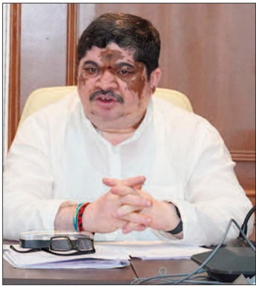
ఆదిలాబాద్, నిజామాబాద్ కేంద్రాల్లో మొక్కజొన్న కొనుగోలు