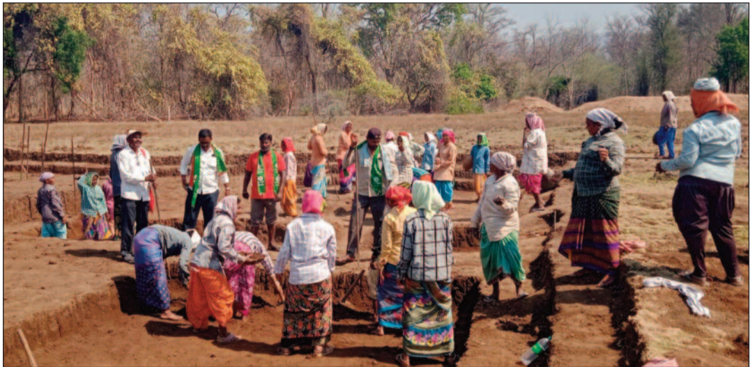
స్థలంలో ప్రథమ చికిత్సకు మెడికల్ కిట్లు అందుబాటులో లేవని మండిపడ్డారు.

అధికారుల నిర్లక్ష్యం కూలీలకు కనీసం తాగునీరు సరఫరా చేయడం లేదని, అధికారులు కేవలం కాగితాల మీద స్టేట్మెంట్లకే పరిమితమవుతున్నారని విమర్శించారు. మండల స్థాయి అధికారులు ఏ రోజూ పని స్థలాలను సందర్శించి తనిఖీలు చేసిన దాఖలాలు లేవన్నారు. విధుల్లో నిర్లక్ష్యం వహిస్తున్న అధికారులపై జిల్లా స్థాయి అధికారులు స్పందించి కఠిన చర్యలు తీసుకోవాలని డిమాండ్ చేశారు.