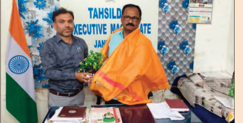
తుడుం జిలేందర్, జనం పవర్, ఉత్తర తెలంగాణ బ్యూరో

కలెక్టర్ ఉత్తర్వుల మేరకు నియామకం పుష్కరించిన ఇచ్చి స్వాగతం పలికిన సిబ్బంది