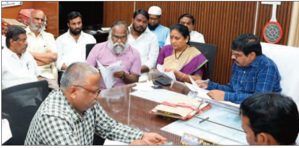
జూనియర్ కళాశాల, ఉమ్మడి డిగ్రీ కళాశాల, బామ్మ హైస్కూల్ వంటి సంస్థల్లో అదనపు గదులు, హాస్టల్ వసతుల అవసరాలపై సమగ్రంగా చర్చించారు.