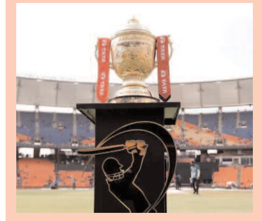
ఇదే ఐపీఎల్ ప్రత్యేకత అని చెప్పాలి.