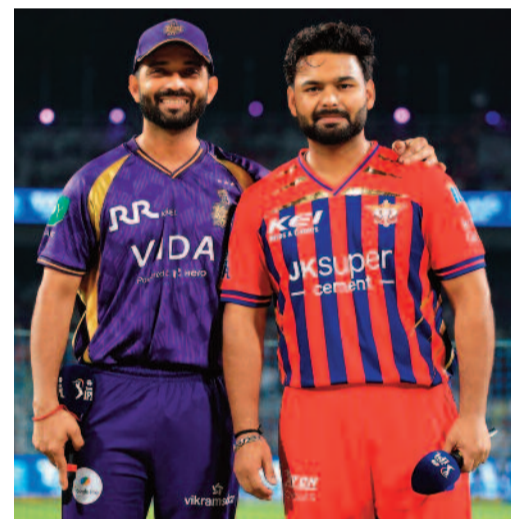
కోల్కతా బ్యాటింగ్ తీరు

కోల్కతా, ఏప్రిల్ 9: ఐపీఎల్ టోర్నీలో భాగంగా గురువారం ఈడెన్ గార్డెన్స్ వేదికగా కోల్కతా నైట్ రైడర్స్, లక్నో సూపర్ జెయింట్స్ మధ్య జరిగిన మ్యాచ్ అభిమానులను మునివేళ్లపై నిలబెట్టింది. ఆఖరి బంతి వరకు ఉత్పందభరితంగా సాగిన ఈ పోరులో లక్నో జట్టు 3 వికెట్ల తేడాతో అద్భుత విజయాన్ని నమోదు చేసింది. టాప్ గెలిచిన లక్నో కెప్టెన్ ముందుగా బౌలింగ్ ఎంచుకున్నాడు. తొలుత బ్యాటింగ్ చేసిన కోల్కతా నిర్ణీత 20 ఓవర్లలో 4 వికెట్ల నష్టానికి 181 పరుగులు చేసింది. లక్నో ఛేదనలో లక్నో జట్టు 7 వికెట్లు కోల్పోయి ఆఖరి బంతికి విజయాన్ని అందుకుంది.