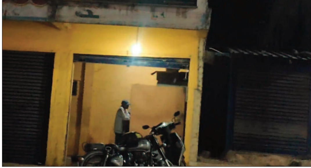
అరేబిలు వస్తున్నాయి. అక్రమ విక్రయాలపై తక్షణమే డిమాండ్ చేస్తున్నారు. దీనిపై అధికారులు ఎలా స్పందిస్తారో దారులు నిర్వహించి కఠిన చర్యలు తీసుకోవాలని ప్రజలు వేచి చూడాలి.