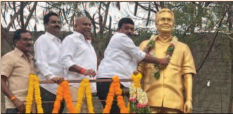
కలీంగర్, మార్చి 18 (జనం పవర్):

వర్ధంతి సందర్భంగా దివంగత నేత విగ్రహానికి ఘన నివాళులు