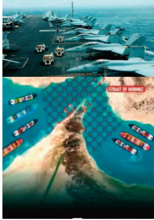
జలసంధి మార్గం దాదాపు మాతవడటంతో అంతర్జాతీయ మార్కెట్లో చమురు ధరలు రికార్డు స్థాయికి చేరుకున్నాయి.

వాషింగ్టన్/టెహ్రాన్, మార్చి 18: మధ్యప్రాచ్యంలో యుద్ధ జ్వాలలు అదుపు తప్పి ఎగిసిపడుతున్నాయి. ఇరాన్ లక్ష్యాంగా అమెరికా బలగాలు బుధవారం తెల్లవారుజామున అత్యంత శక్తిమంతమైన వైమానిక దాడులకు దిగాయి. వ్యూహాత్మకంగా కీలకమైన హార్వాజ్ జలసంధి తీరప్రాంతంలో ఉన్న ఇరాన్ భూగర్భ క్షిపణి స్థావరాలే లక్ష్యంగా ఈ దాడులు జరిగాయి. సుమారు 2,268 కిలోల బరువుండే 'బంకర్ బస్టర్' బాంబులను ప్రయోగించి, కాంట్రీల్ కట్టడాలను చేదించుకుంటూ వెళ్లి లోపల ఉన్న నౌకా విధ్వంసక క్షిపణులను అమెరికా ధ్వంసం చేసింది. అంతర్జాతీయ నౌకాయానానికి ముప్పు పొంచి ఉందన్న నిఘా వర్గాల సమాచారంతోనే ఈ ఆపరేషన్ చేపట్టినట్లు అమెరికా సెంట్రల్ కమాండ్ అధికారికంగా ప్రకటించింది.