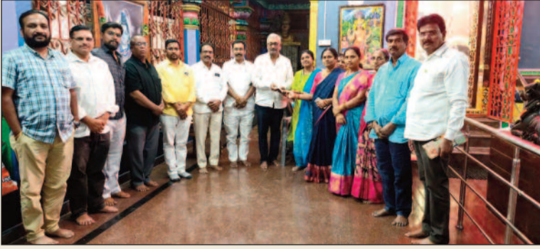
సంగారెడ్డి, మార్చి 18 (జనం పవర్):

వీరశైవ సమాజం ఆధ్వర్యంలో భారీ ఏర్పాట్లు మహిళల పెద్ద ఎత్తున పాల్గొనాలని ఇప్పటికే నర్సింపేట పిలుపు