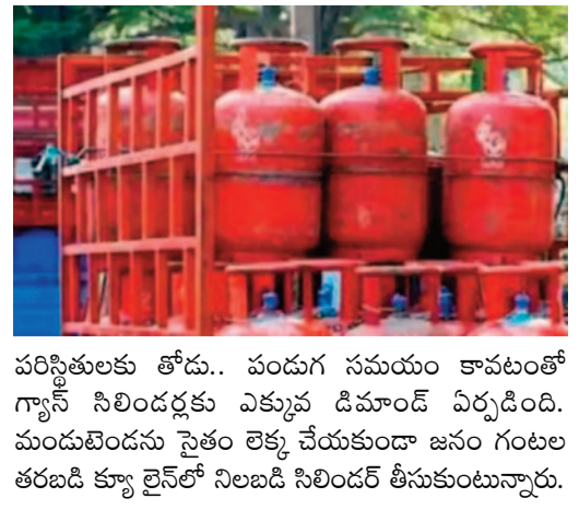
పరిస్థితులకు తోడు.. పండుగ సమయం కావటంతో గ్యాస్ సిలిండర్లకు ఎక్కువ డిమాండ్ ఏర్పడింది. మందులొందను సైతం లెక్క చేయకుండా జనం గంటల తరబడి క్యూ లైన్లో నిలబడి సిలిండర్ తీసుకుంటున్నారు.

కేంద్రం కమర్షియల్ గ్యాస్ సిలిండర్ల సరఫరాను పూర్తిగా నిలిపి వేసింది. దీంతో దేశ వ్యాప్తంగా ఉన్న హోటళ్లు, రెస్టారెంట్లు మెల్లమెల్లగా మూతపడుతున్నాయి. హోస్టల్స్ మెనూను పూర్తిగా మార్చేశాయి. కేవలం ఒక కర్రితో సరిపెడుతున్నాయి. గ్యాస్ కొరత కారణంగా పలు దేవాలయాలు తాత్కాలికంగా ప్రసాదం తయారీని నిలిపివేశాయి. సీఎన్జీ బంకుల్లోనూ గ్యాస్ నిల్వలు అడుగంటుతున్నాయి. దీని కారణంగా గ్యాస్ తో నడిచే వందలాది ఆటోలు నిలిచిపోతున్నాయి. డొమెస్టిక్ గ్యాస్ సిలిండర్ల వినియోగదారులకు కూడా కష్టాలు తప్పటం లేదు. బుకింగ్, డెలివరీ విషయంలో నానా ఇబ్బందులు పడాలి వస్తోంది. గ్యాస్ సిలిండర్ కోసం వినియోగదారులు గంటల తరబడి క్యూలో వేచి ఉంటున్నారు. యుద్ధ