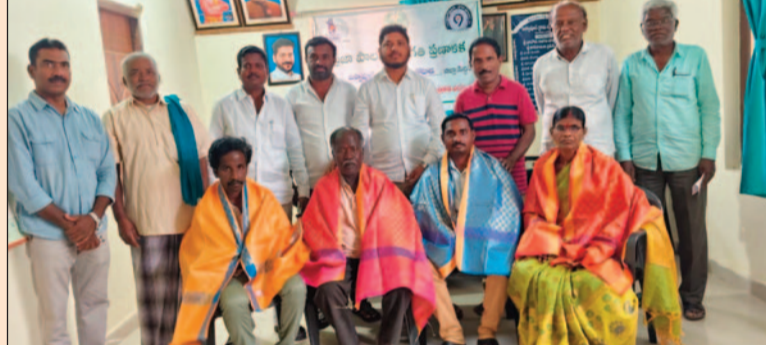
కోపాడ, మార్చి 16 (జనం పవర్):

బస్సాపూర్ లో ఘనంగా పాలిశుద్ధ్య కార్మికుల సన్మానం రక్షణ పరికరాలు, సాకర్యాలు కల్పించాలని విజ్ఞప్తి