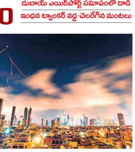
దుబాయ్ ఎయిర్పోర్ట్ సమీపంలో దాడి ఇంధన ట్యాంక్ వద్ద చెలరేగిన మంటలు

అధికారులు ప్రకటించారు. ప్రయాణికులు, ఎయిర్పోర్టు సిబ్బందికి సేఫ్టీ నోటీస్ జారీచేశారు. విమానాల స్టేబిల్ తెలుసుకునేందుకు విమానయాన సంస్థలను సంప్రదించాలని ప్రయాణికులకు సూచించేశారు. అంతేగాక పలు విమానాలను అల్ మక్కామ్ అంతర్జాతీయ విమానాశ్రయానికి మళ్లించినట్లు ఎయిర్పోర్ట్ అధికారులు తెలిపారు. ఇంధన ట్యాంక్కు అంటుకున్న మంటలను అర్పేందుకు దుబాయ్ సివిల్ డిఫెన్స్ సిబ్బంది తీవ్రంగా శ్రమిస్తున్నారు. సమీపంలోని ప్రజలు ఇళ్లలోనే ఉండాలని అధికారులు ఆదేశాలు జారీ చేశారు. ఇంధన ట్యాంక్పై దాడి నేపథ్యంలో ఈ ప్రాంతంలోని కీలకమైన ఇతర మౌలిక సదుపాయాల వద్ద భద్రత పెంచినట్లు అధికారులు పేర్కొన్నారు.