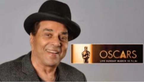
సినీ కెరీర్ కలిగిన కోట శ్రీనివాసరావు గతేడాది జులై 13న మరణించిన విషయం తెలిసింది.

తన అధికారిక వెబ్సైట్లో ప్రత్యేకంగా పొందుపరిచింది. ఆస్కార్ వేడుక ప్రారంభంలో గతేడాది మరణించిన హోలీవుడ్ ప్రముఖులకు నివాళులర్పిస్తూ వీడియోను ప్రదర్శించారు. వారిని స్మరించుకుంటూ వారితో ఉన్న జ్ఞాపకాల గురించి కొందరు వేదికపై మాట్లాడారు. అయితే, ఆ వీడియోలో ధర్మేంద్రను చూపించకపోవడంతో అభిమానులు అసహనం వ్యక్తంచేస్తూ ఎక్స్ వేదికగా పోస్టులు పెట్టారు. సమయాభావం వల్ల వీడియోలో కొందరినే చూపారని.. ఆ తర్వాత అందరి పేర్లను అధికారిక వెబ్సైట్లో పొందుపరిచారని హోలీవుడ్ మీడియా పేర్కొంది. 89 ఏళ్ల వయసులో గతేడాది నవంబర్ 24న ధర్మేంద్ర తుదిశ్వాస విడిచారు. సినీ పరిశ్రమకు ఆయన చేసిన సేవలను గుర్తించిన కేంద్రం పద్మ విభూషణ్తో సత్కరించింది. ఇక 40 ఏళ్ల సుదీర్ఘ