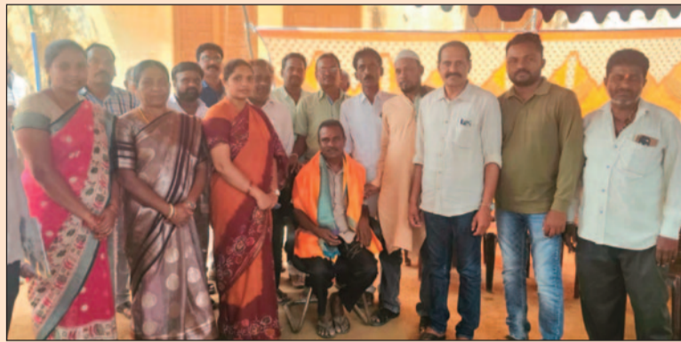
తుడుం జిత్తెండ్ల - జనం పవర్ - ఉత్తర తెలంగాణ బ్యూరో

పోనకల్ సంతల వేలంలో గ్రామ పంచాయతీకి 14.14 లక్షల భారీ ఆదాయం