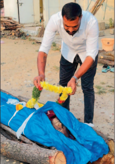
పటాన్ చెరు, మార్చి 16 (జనం పవర్):

అనాధ మృతదేహానికి అంత్యక్రియలు నిర్వహించిన ఎండీఐ ఫౌండేషన్ పటాన్ చెరులో మానవత్వం చాటుకున్న వైనం