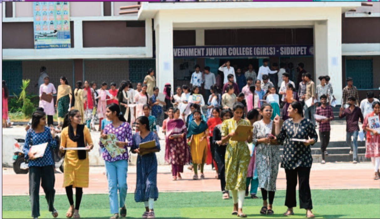
జనం పవర్ - సిద్దిపేట ప్రతినధి

సిద్దిపేట జిల్లా పట్టణంలోని బాలికల జూనియర్ కళాశాలలో రెండు వేల ఇరవై ఐదు - ఇరవై ఆరు విద్యా సంవత్సరానికి సంబంధించిన ఇంటర్మీడియట్ మొదటి, రెండో సంవత్సరం పరీక్షలు విజయవంతంగా ముగిశాయి. పరీక్షలు పూర్తి కావడంతో విద్యార్థినులు ఆనంద కేరింతలతో పరీక్షా హాల్ నుంచి బయటకు వస్తూ తమ సంతోషాన్ని పంచుకున్నారు.