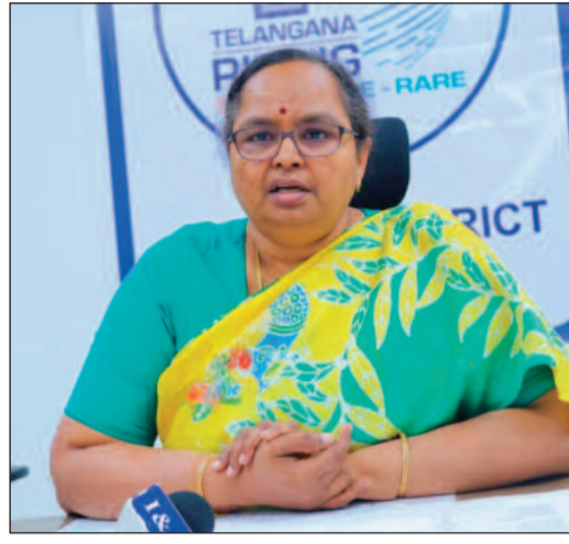
ప్రభుత్వ ప్రాధాన్యత సంస్థలకు గ్యాస్ సరఫరా

యుద్ధ వాతావరణ పరిస్థితులు ఉన్నప్పటికీ ప్రభుత్వం ఇతర దేశాల నుంచి ఇంధనాన్ని దిగుమతి చేసుకుని సరఫరా చేస్తోందిని కలెక్టర్ చెప్పారు. ప్రభుత్వ ప్రాధాన్యత గల గురుకుల విద్యాలయాలు, సంక్షేమ వసతి గృహాలు,