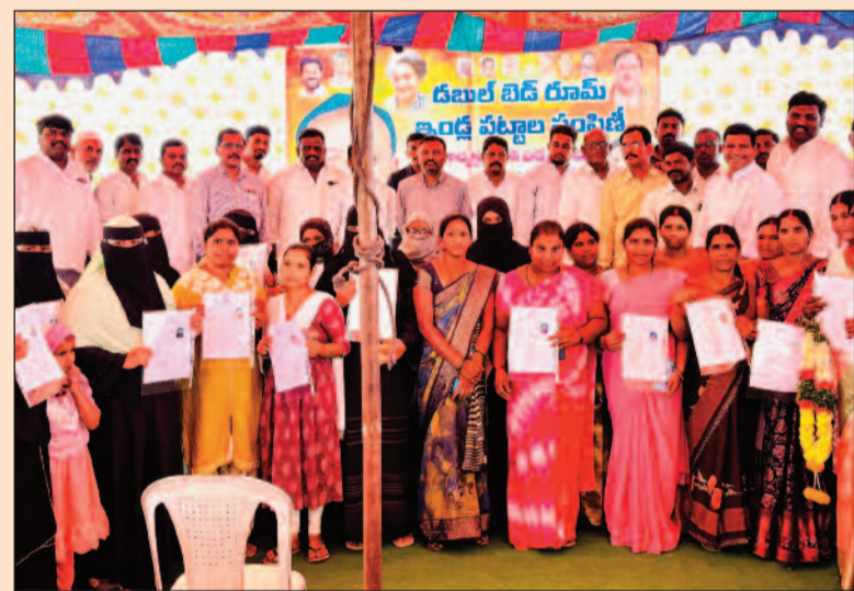
జుమ్మా, మార్చి 13 (జనం పవర్):