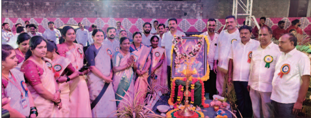
విద్యే భవిష్యత్తుకు బలమైన పునాది