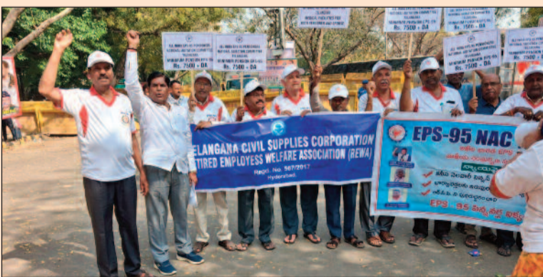
సంగారెడ్డి, మార్చి 13 (జనం పవర్):

ధీల్లీ జంతర్ మంతర్ వద్ద భారీ ధర్నా కేంద్ర ప్రభుత్వంపై ఒత్తిడి తెచ్చిన జాతీయ సంఘర్షణ కమిటీ