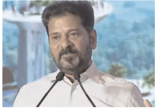
వ్యతిరేకం కాదని సీఎం రేవంత్ రెడ్డి భరోసా ఇచ్చారు.

కేవలం రంగారెడ్డి జిల్లా ప్రయోజనాలే కాకుండా, కలుషిత నీటితో ఇబ్బంది పడుతున్న నల్గొండ జిల్లా రైతాంగం గురించి కూడా ఆలోచించాలని సీఎం కోరారు. గోదావరి జలాల్లో 20 టీఎంసీలను మూసీకి తరలించే పనులు ప్రారంభించామని, తద్వారా మూసీలో నిరంతరం 2.5 టీఎంసీల స్వచ్ఛమైన నీరు ప్రవహించేలా చర్యలు తీసుకుంటున్నామని వెల్లడించారు. బాపూఫూల్ వద్ద రెండు నదుల సంగమ ప్రాంతాన్ని కన్యాకుమారి తరహాలో తీర్చిదిద్దాలామని, అక్కడ రూ. 75 కోట్లతో బాపూ విగ్రహాన్ని ఏర్పాటు చేయనున్నట్లు తెలిపారు. బుల్డోజర్ల ప్రస్తావన తెస్తూ ప్రతిపక్షాలు పేదలను భయపెట్టడం మానుకోవాలని, అభివృద్ధి ఎవరికీ