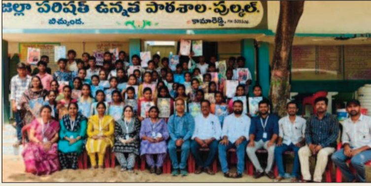
జిమ్మండ్, మార్చి 13 (జనం పవర్):