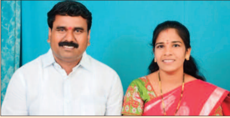
బెజ్జంకి, మార్చి 13 (జనం పవర్):

పదో తరగతి పరీక్షలపై తాజా మాజీ ఎంపీపీ ఆకాంక్ష లక్ష్య సాధన దిశగా సాగాలన్న లింగాల నిర్దేశ లక్ష్యం