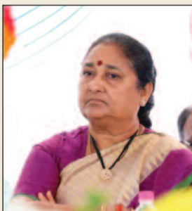
సాంకేతిక విభాగాల్లో కొలువులు

తెలంగాణ రాష్ట్ర ప్రభుత్వం ప్రారంభించిన తొంభై తొమ్మిది రోజుల ప్రజా పాలన - ప్రగతి ప్రణాళిక కార్యక్రమంలో భాగంగా తెలంగాణ డిజిటల్ ఉపాధి వేదిక (డీకూకూటి) ఆధ్వర్యంలో నిర్వహించిన మహేంద్రా - మహేంద్రా ట్రాక్టర్ మోగా జాబ్ డ్రైవ్ విజయవంతంగా జరిగింది. సంగారెడ్డి ప్రభుత్వ పాలిటెక్నిక్ కళాశాలలో శుక్రవారం నిర్వహించిన ఈ జాబ్ డ్రైవ్ ద్వారా జూనియర్ లెవెల్లోని మహేంద్రా - మహేంద్రా స్టాంట్లో ఎనిమిది వందలకు పైగా ఉద్యోగాల భర్తీ లక్ష్యంగా ఇంటర్వ్యూలు నిర్వహించారు. మార్చి 13న ఉదయం తొమ్మిది గంటల నుండి మధ్యాహ్నం మూడు గంటల వరకు జరిగిన ఈ జాబ్ డ్రైవ్ యువత నుంచి మంచి స్పందన లభించింది. మొత్తం ఏడు వందల యాభై ఆరు మంది అభ్యర్థులు నమోదు చేసుకోగా, మొదటి దశ టెలిఫోన్ ఇంటర్వ్యూలో రెండు వందల తొంభై ఐదు మంది ఎంపికయ్యారు. వారిలో నూట ఇరవై ఐదు మంది ప్రత్యక్షంగా జాబ్ డ్రైవ్ కు హాజరయ్యారు. చివరగా డెబ్బై ఎనిమిది మంది అభ్యర్థులకు ఉద్యోగ అవకాశాలు లభించగా వారికి నియామక పత్రాలు అందజేశారు.