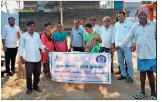
బెజ్జంకి, మార్చి 13 (జనం పవర్):

రామసాగర్ సర్పంచ్ ఇంగాల లక్ష్మి పిలుపు ఇంటింటికీ తిరిగి 'డ్రై డే' గై ఖామస్థులకు అవగాహన