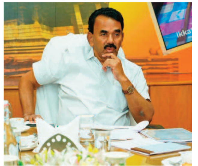
మగతా 2 లో

హైదరాబాద్, మార్చి 10: రాష్ట్రంలో మౌలిక సదుపాయాల కల్పనే ద్వేయంగా ప్రభుత్వం ఆడుగులు వేస్తోంది. రాజీయే మూడేళ్లలో శాశ్వత భవనాలు లేని అన్ని గ్రామ పంచాయతీలకు కొత్త భవనాలు నిర్మిస్తామని ఉప ముఖ్యమంత్రి భట్టి విక్రమార్క స్పష్టం చేశారు. బడ్జెట్ రూపకల్పనలో భాగంగా మంగళవారం సచివాలయంలో వివిధ శాఖల అధికారులూ, మంత్రులతో ఆయన సుదీర్ఘ సమీక్ష నిర్వహించారు. బీసీ సంక్షేమ శాఖ అధికారులతో భేటీ అయిన డిప్యూటీ సీఎం. హాస్పిట్లు, గురుకులాల