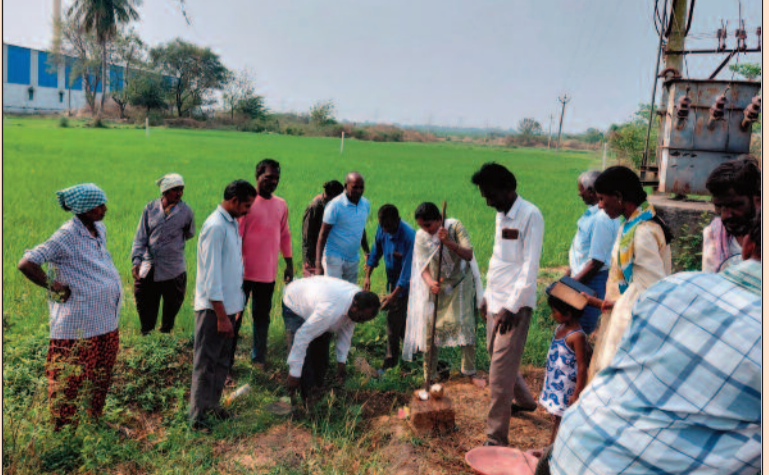
బెజ్జంకి, మార్చి 10 (జనం పవర్):

తోటపల్లిలో చెరువు కాలువ పూడికతీత పనులు ప్రారంభం