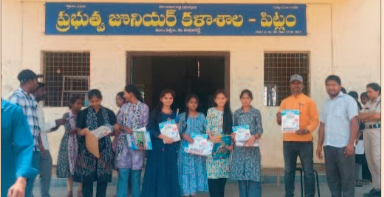
జుక్కల్, మార్చి 10 (జనం పవర్):

ఇంటర్ పరీక్ష కేంద్రాల వద్ద అధ్యాపక బృందం కరపత్రాల పంపిణీ ప్రభుత్వ కళాశాలలో చేరాలని విద్యార్థులకు పిలుపు