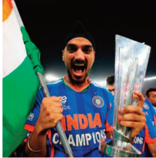
చేరింది. కేవలం పురుషుల జట్ల కాకుండా, గతేడాది మహిళల వన్డే ప్రపంచకప్ ను హార్మన్ ప్రీత్ సేన

గెలుకుకోవడం భారత క్రికెట్ లో నవకానికి నాంది పలికింది. నేడు దేశంలో క్రికెట్ కేవలం ఒక ఆట మాత్రమే కాదు, దాదాపు 100 కోట్ల మందిని ఏకం చేసే ఒక భావోద్వేగంగా మారింది.