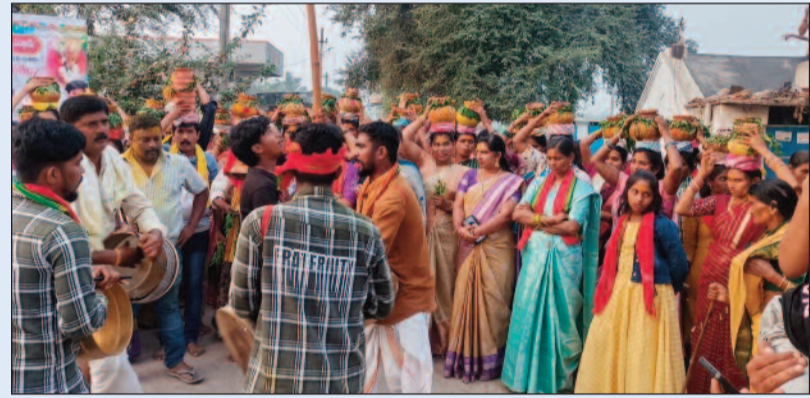
రామడుగు, మార్చి 10 (జనం పవర్):

శివసత్తుల పూసకాలు.. పోతురాజుల విన్యాసాలతో ఆధ్యాత్మిక శోభ