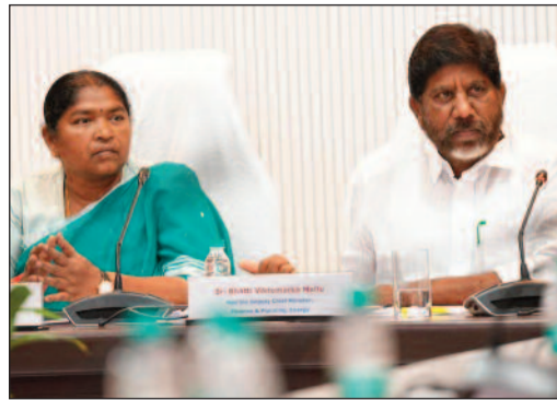
పూర్తి స్థాయిలో విడుదల చేయమనే కోరికతో అధికారులను ఆదేశించారు. గత ప్రభుత్వ నిర్ణయాల వల్ల పెండింగ్లో

పంచాయతీరాజ్ వ్యవస్థ బలోపేతానికి ప్రభుత్వం కట్టుబడి ఉందని మంత్రి సీతక్క స్పష్టం చేశారు. కేంద్రం నుంచి రాష్ట్రానికి రావాల్సిన 15వ ఆర్థిక సంఘం నిధులను