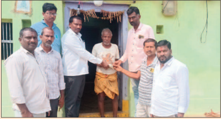
జనం పవర్ - సిద్దిపేట ప్రతినది