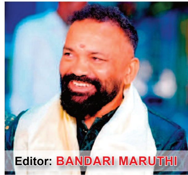
Editor: BANDARI MARUTHI

కరీంనగర్ ఆదివారం 22.02.2026 సంపుటి : 14 సంచిక : 262 పేజీలు: 09 వెల: 5/- Karimnagar Sunday 22.02.2026 Valume : 14 Issue : 262 Pages : 09 Cost: 5/-