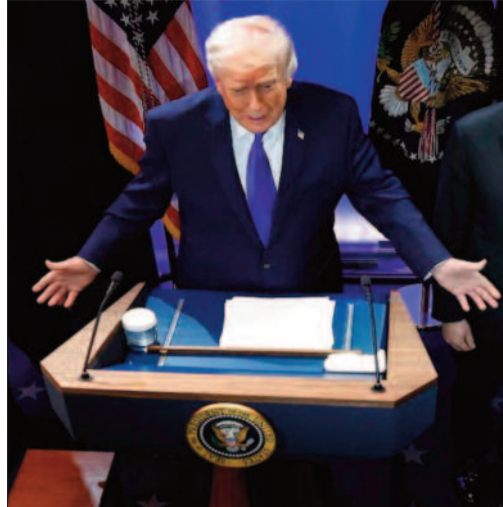
ఉ భారత్ పై వ్యాఖ్యలు

న్యూఢిల్లీ, ఫిబ్రవరి 21: అమెరికా సుప్రీంకోర్టు తన పూర్వ టారిఫ్ నిర్ణయాలను రద్దు చేసిన అనంతరం అధ్యక్షుడు డోనాల్డ్ ట్రంప్ కొత్త నిర్ణయం ప్రకటించారు. ప్రపంచంలోని అన్ని దేశాలపై 10 శాతం గ్లోబల్ టారిఫ్ విధిస్తున్నట్లు వెల్లడించారు. ఈ మేరకు ఓవల్ ఆఫీస్ లో ఎగ్జిక్యూటివ్ ఆర్డర్ పై సంతకం చేసినట్లు తెలిపారు. వైట్ హౌస్ ప్రకటన ప్రకారం ఈ సుంకాలు ఫిబ్రవరి 24 నుంచి అమల్లోకి వచ్చి 150 రోజుల పాటు కొనసాగునున్నాయి. సుప్రీంకోర్టు తన అధికారాలను పరిమితం చేస్తూ ఇచ్చిన తీర్పుపై తీవ్ర నిరాశ వ్యక్తం చేసిన ట్రంప్, “అవసరమైతే ప్రత్యామ్నాయ చట్టాల కింద మరింత కఠిన చర్యలు తీసుకుంటాం” అని హెచ్చరించారు. పాత చట్టం కింద విధించిన టారిఫ్లను కోర్టు కొట్టివేస్తే, ‘సెక్షన్ 122’ కింద 10 శాతం గ్లోబల్ సుంకం అమలు చేస్తామని స్పష్టం చేశారు. అవసరమైతే ఏ దేశంపైనైనా వాణిజ్య దిగ్బంధం విధించే అధికారం తనకు ఉందని పేర్కొన్నారు.