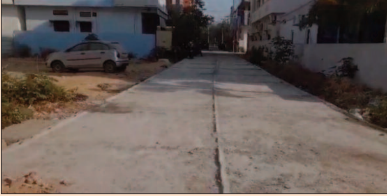
సంగారెడ్డి ఫిబ్రవరి 21 (జనం పవర్):

రూ. 7.50 కోట్ల వ్యయంతో పలు కాలనీల్లో సీసీ రోడ్ల పనులు పనులు వేగంగా సాగుతున్నా పర్యవేక్షణ కరువైన వైనం నాణ్యత ప్రమాణాలు పాటించాలని మున్సిపల్ కమిషనర్ ఆదేశం