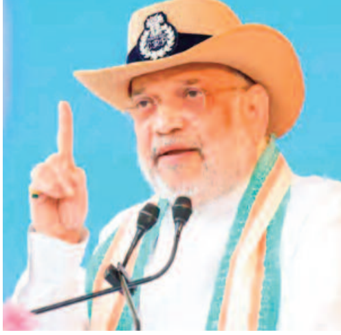
అందరికీ ఆదర్శంగా సీఆర్పీఎఫ్ నిలుస్తోందని పేర్కొన్నారు.

వారు ఆక్రమించిన స్థలాల నుంచి తరిమికొట్టినంత మాత్రాన సమస్య తీరిపోదు. వారు మరోచోట స్థిరపడే అవకాశం ఉంది. ఈ నేపథ్యంలో వారిని మొత్తంగా దేశం నుంచి బయటకు పంపించాలి. అక్రమ వలసదారులను బహిష్కరిస్తామని గతంలో కాంగ్రెస్ నేత రాహుల్ గాంధీ చెప్పారు. కానీ.. కాంగ్రెస్ ఆ పని చేయబోదు. ఎందుకంటే వారే ఆ పార్టీకి ఓటు బ్యాంకు' అని అమిత్ షా ఆరోపించారు. చొరబాటుదారులను రక్షించాలనే హస్తం పార్టీ విధానాలు.. అస్సాంకు ముప్పుగా మారాయని విమర్శించారు. ఒకవేళ వారిపై చర్యలు తీసుకునే విషయానికి కాంగ్రెస్ కట్టుబడి ఉంటే.. పార్టీ ఎన్నికల మేనిఫెస్టోలో ఆ విషయాన్ని పొందుపర్చాలని సవాల్ విసిరారు. రానున్న ఐదేళ్లలో ఈశాన్య భారతంలో అస్సాం పారిశ్రామిక కేంద్రంగా మారుతుందని అమిత్ షా చెప్పారు. అనంతరం గువాహాటిలో నిర్వహించిన సీఆర్పీఎఫ్ డే పరేడ్ లో పాల్గొన్నారు. శౌర్యపరాక్రమాలు, దేశభక్తిలో