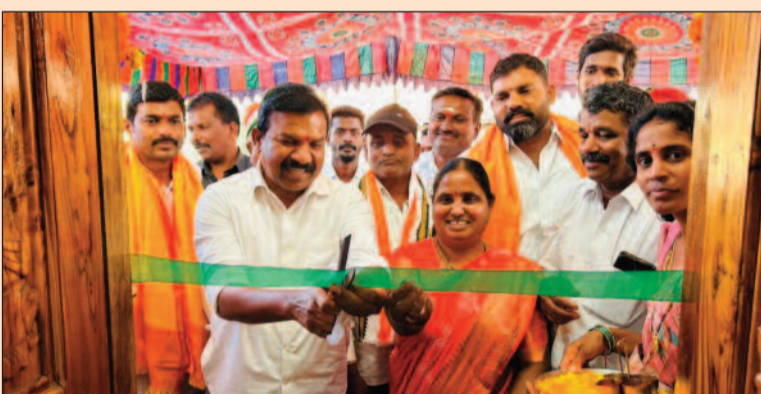
బెజ్జంకి ఫిబ్రవరి 21 (జనం పవర్):

పేద ప్రజల సొంతింటి కల నెరవేర్చడమే తమ ప్రజా ప్రభుత్వ లక్ష్యమని మానకొందూరు ఎమ్మెల్యే డాక్టర్ కవ్వంపల్లి సత్యనారాయణ స్పష్టం చేశారు. శనివారం బెజ్జంకి మండలంలోని లక్ష్మీపూర్ గ్రామంలో ఇందిరమ్మ ఇళ్ల నిర్మాణం పూర్తి చేసుకున్న లబ్ధిదారుల నూతన గృహప్రవేశ కార్యక్రమాల్లో ఆయన పాల్గొన్నారు. రిట్టన్ కట్ చేసి గృహాలను ప్రారంభించిన అనంతరం లబ్ధిదారులకు శుభాకాంక్షలు తెలిపారు. ఈ సందర్భంగా ఆయన మాట్లాడుతూ.. ప్రజా సంక్షేమమే కాంగ్రెస్ ప్రభుత్వ ప్రధాన ధ్యేయమని, ఇల్లు లేని ప్రతి నిరుపేదకు ఇల్లు నిర్మించి ఇచ్చే వరకు ప్రభుత్వం కృషి చేస్తుందని చెప్పారు. గృహప్రవేశాల అనంతరం గ్రామంలోని శివాలయానికి సంబంధించి నూతన ప్రహారీ గోడ నిర్మాణ పనులకు ఎమ్మెల్యే భూమి పూజ నిర్వహించారు. గ్రామంలోని భక్తి భావాన్ని చాటుకునేలా ఆలయాల అభివృద్ధికి కూడా ప్రభుత్వం సహకరిస్తుందని పేర్కొన్నారు. అక్కడి నుండి వడ్డూరు గ్రామానికి చేరుకున్న ఎమ్మెల్యే పాఠశాల ఆవరణలో నూతనంగా మంజూరైన అంగన్ వాడీ భవన నిర్మాణానికి శంకుస్థాపన చేశారు. అలాగే పాఠశాల మట్టా ప్రహారీ గోడ నిర్మాణానికి, నూతన వంటగది నిర్మాణ పనులకు భూమి పూజ చేశారు. ప్రభుత్వ పాఠశాలల్లో విద్యార్థులకు మెరుగైన వసతులు కల్పించడమే లక్ష్యంగా ఈ పనులు చేపడుతున్నట్లు వివరించారు. ఈ కార్యక్రమంలో ఆయా గ్రామాల సర్పంచులు, వార్డు సభ్యులు, కాంగ్రెస్ నాయకులు, కార్యకర్తలు పెద్ద సంఖ్యలో పాల్గొన్నారు.