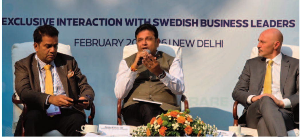
EXCLUSIVE INTERACTION WITH SWEDISH BUSINESS LEADERS FEBRUARY 20, 2025 NEW DELHI

నగరాల అభివృద్ధి, క్లీన్ ఎనర్జీ, డిజిటల్ మేనేజ్ మెంట్ తదితర రంగాలకు విస్తరించేందుకు చర్యలు తీసుకుంటున్నా మన్నారు. తెలంగాణా అవకాశాల గని.. అపారమైన టాలెంట్ పూల్ మా బలం అని మంత్రి అన్నారు. తెలంగాణలో ఏటా పరిశోధనలు, అభివృద్ధులకు ప్రభావశీలమైన టాలెంట్ పూల్ ఉందని తెలిపారు. ఏటా సమగ్ర లో స్వీడెన్ వాణిజ్య ప్రతినిధులను ఉద్దేశించి ప్రసంగించారు. కృత్రిమ మేధ వెలుగు వల్ల ఎదురయ్యే సవాళ్లను, అది తీసుకువచ్చే అవకాశాలను అందిపుచ్చుకునేందుకు సిఎం రేపంత్ రెడ్డి నాయకత్వంలోని మా ప్రభుత్వం ముందే సంసిద్ధమైంది. దానికి తగ్గట్లుగా సాఫ్ట్ వేర్ నిపుణులు నైపుణ్యాల పెంచే కార్యక్రమాలు ప్రారంభించాం. ఇదిలావుంటే ఏటా సాఫ్ట్ వేర్ విభాగం గణనీయమైన మార్పులు వస్తాయి. అందుకు అవసరమైన సన్నద్ధమైన మొదలు పెట్టింది మా ప్రభుత్వమే. ఏటా పరిశోధన కేంద్రాలు, అభివృద్ధి, సేవల వల్ల కొత్త ఉద్యోగాలు సృష్టించాం. యువత దీనిని అందిపుచ్చుకోవాలి. యువత, వృత్తి నిపుణులు మరొక సృజనాత్మక బాధ్యతలు చేపట్టేందుకు ఏటా అపారమైన