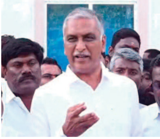
చేయడం లేదని దుయ్యబట్టారు. రైతు భరోసా నిధుల విడుదలపై ప్రభుత్వం చేస్తున్న తాత్కాలిక హాల్షి రావు తప్పుపట్టారు. మున్సిపల్ అనికల్ కోడ్ ముగియగానే

17వ తేదీన రైతు బంధు (రైతు భరోసా) ఇస్తామని చెప్పి, నేడు 20వ తేదీ వచ్చినా ఎందుకు నిధులు వేయలేదని సీఎం రేపంత్ రెడ్డిని నిలదీశారు. “రైతు బంధు ఎప్పుడు ఇస్తారు? నాట్లు వేసేటప్పుడు లేక కోతలు జరిగేటప్పుడు? బడా కాంట్రాక్టర్ల దగ్గర కమిషన్ కోసం రూ. 20 వేల కోట్ల బకాయిలు చెల్లించిన సర్కార్ కు, రైతులకు వేయడానికి డబ్బులు లేవా?” అని ఆయన నిలదీశారు. 2026 మార్చి కల్లా దేవాదుల పూర్తి చేస్తామని చెప్పిన మంత్రులు ఇప్పుడు ఎక్కడికి పోయారని హాల్షి రావు ప్రశ్నించారు. తాము అధికారంలో ఉన్నప్పుడు రూ. 7,300 కోట్లు ఖర్చు చేసి 80 శాతం పనులు పూర్తి చేశామని, మిగిలిన 2.40 లక్షల ఎకరాల ఆయకట్టు స్థిరీకరణకు కాంగ్రెస్ ప్రభుత్వం కనీసం రూ. 100 కోట్లు కూడా ఖర్చు చేయడం లేదని విమర్శించారు. రైతులను మోసం చేస్తున్న కాంగ్రెస్ ప్రభుత్వానికి తగిన గుణపాఠం తప్పదని హెచ్చరించారు.