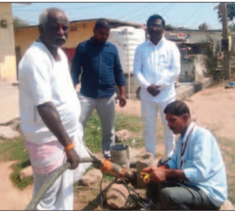
న్యాయం చేస్తామని భరోసా