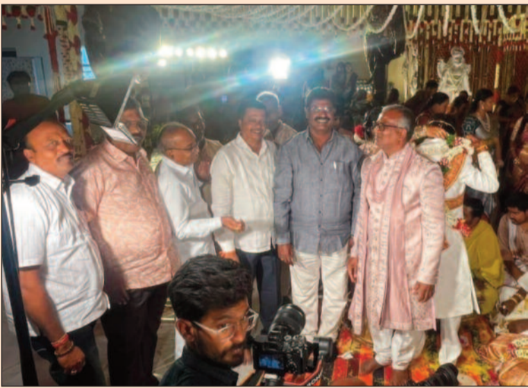
జుక్కల్, ఫిబ్రవరి 20 (జనం పవర్):