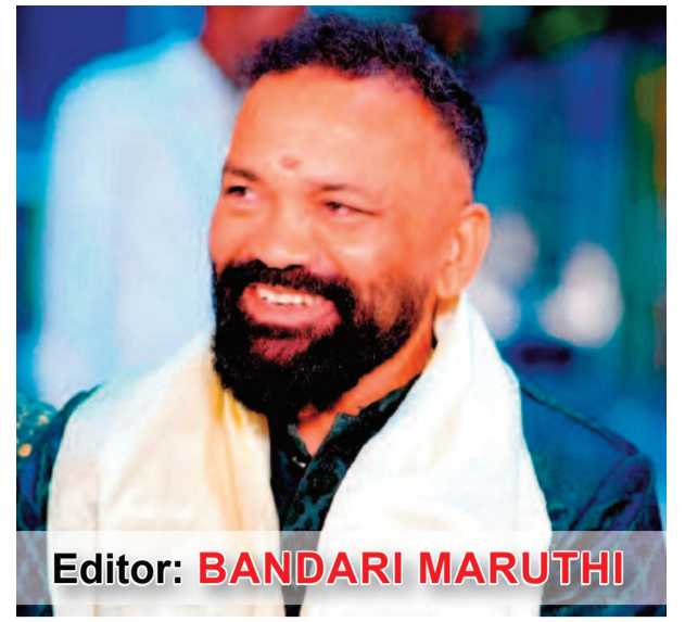
Editor: BANDARI MARUTHI

కరీంనగర్ శనివారం 21.02.2026 సంపుటి : 14 సంచిక : 261 పేజీలు: 09 వెల: 5/- Karimnagar Saturday 21.02.2026 Valume : 14 Issue : 261 Pages : 09 Cost: 5/-