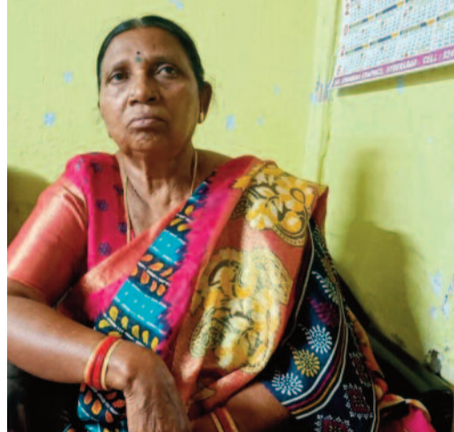
గుర్తు తెలియని దుండగుడు.. ఆమె వద్ద ఉన్న బ్యాగు నుంచి 16 తులాల బంగారు ఆభరణాలను దొంగిలించి