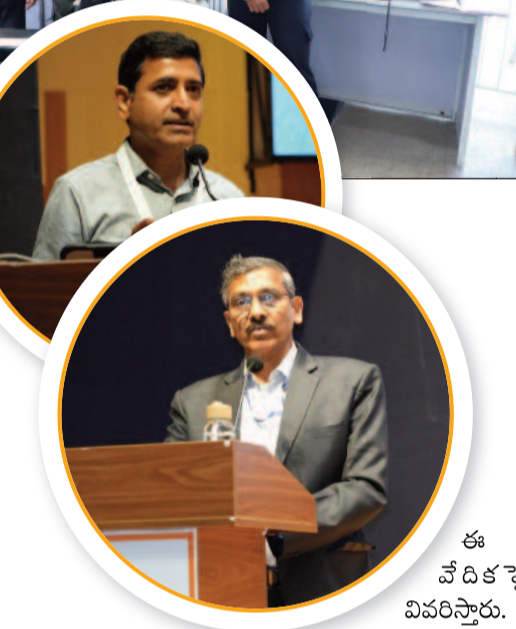
ఈ వేదికపై వివరిస్తారు.

మూడు రోజుల పాటు జరిగే ఈ సదస్సులో ఆర్టిఫిషియల్ ఇంటెలిజెన్స్ (ఏఐ), హెల్త్కేర్, మాన్యుఫ్యాక్చరింగ్ వంటి కీలక రంగాల్లో వస్తున్న సాంకేతిక మార్పులపై ప్రత్యేక ప్రదర్శనలు ఏర్పాటు చేశారు. ఎంఎస్ఎంఈలు పెద్ద పరిశ్రమలతో అనుసంధానం కావడానికి, నూతన పరిష్కారాన్ని వాణిజ్యపరంగా వాడుకోవడానికి ఈ కార్యక్రమం ఎంతో ఉపయోగపడనుంది. టెక్నాలజీ లైసెన్సింగ్, పరిశోధనల బదిలీ, సహకార ఒప్పందాల వంటి అంశాలపై నిపుణులు