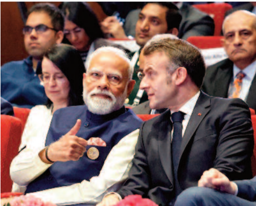
న్యూఢిల్లీ, ఫిబ్రవరి 19: ఆర్డీఫిషియల్ ఇంటిలిజెన్స్ (ఏఐ) సామర్థ్యం మన ఊహలకు అందనంత వేగంగా దూసుకుపోతోందని, అయితే ఈ సాంకేతికత మనిషిని శాసించే స్థాయికి చేరకూడదని ప్రధానమంత్రి నరేంద్ర మోడీ స్పష్టం చేశారు. దేశ రాజధానిలో జరుగుతున్న